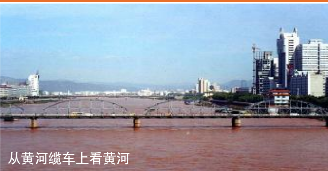
从黄河缆车上观黄河

这是本人在2001年8月时去兰州旅游时写的一篇游记,虽然过去了很久,但时而想起那里的秀美风光,还是让人心生向往之情。