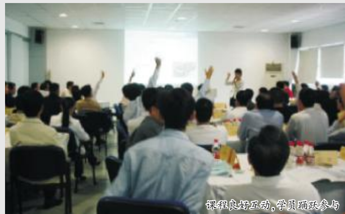
课程良好互动,学员踊跃参与

新闻链接: 杨路老师是时代光华教育发展有限公司特聘高级讲师;北京雅致人生管理顾问公司总裁/首席讲师;2005年度中国女性经济先锋人物;微软(中国)公司员工职业魅力提升培训顾问;国家级出国访问团礼仪培训师。先后服务过IBM公司、中央电视台广告部、福田汽车公司、香格里拉饭店集团等等。