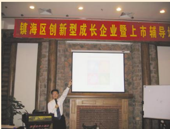
2007年9月,方老师应邀来到宁波市镇海区为镇海区广大创新型成长上市企业管理者开展《情境领导》培训,受到有关机关及学员的赞誉。